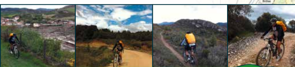
Salinas de Añana